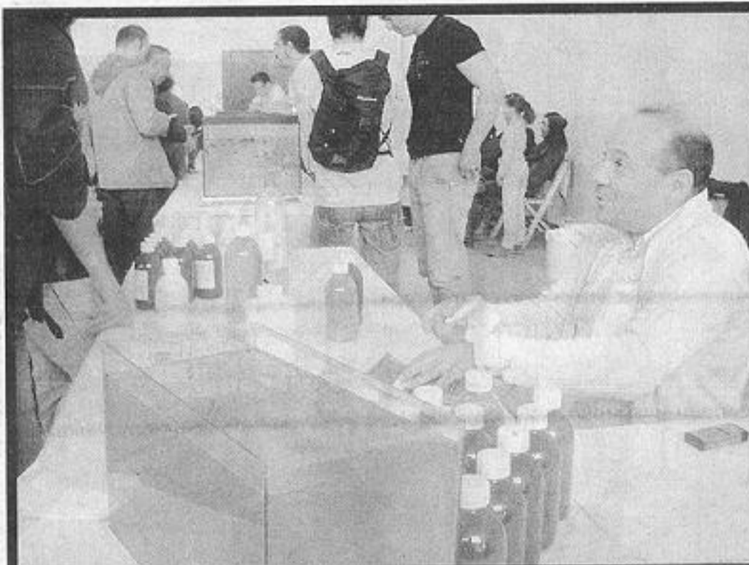
Daphniebio propose et explique l'élevage de daphnies la meilleure des nourritures pour poissons et coraux.