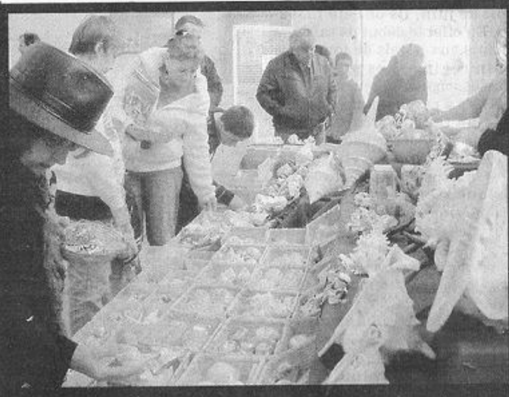
La décoration des aquariums fait aussi parti de cette passion.