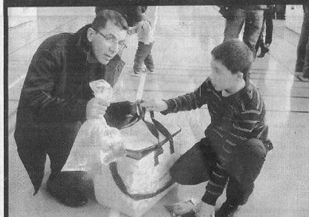
Les acheteurs et passionnés ont même pensé à la glacière pour transporter leurs achats de coraux.